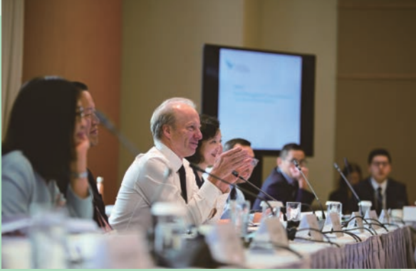
行政總裁歐達禮先生出席由證監會主辦的綠色金融監管會議